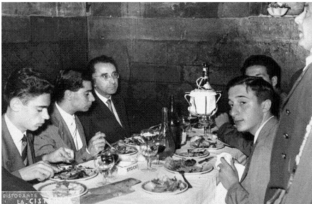
Il pranzo dei maturandi.